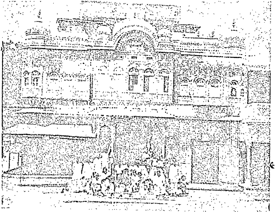
श्री शांतिनाथ दिगम्बर जैन मन्दिर कुकनवाली